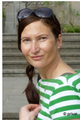
Pola Kayser Tod in Ulrichshusen

288 Seiten, Taschenbuch 12,99 Euro Format: 11,5 x 18,0 cm ISBN 978-3-356-01919-3 Auch als E-Book erhältlich